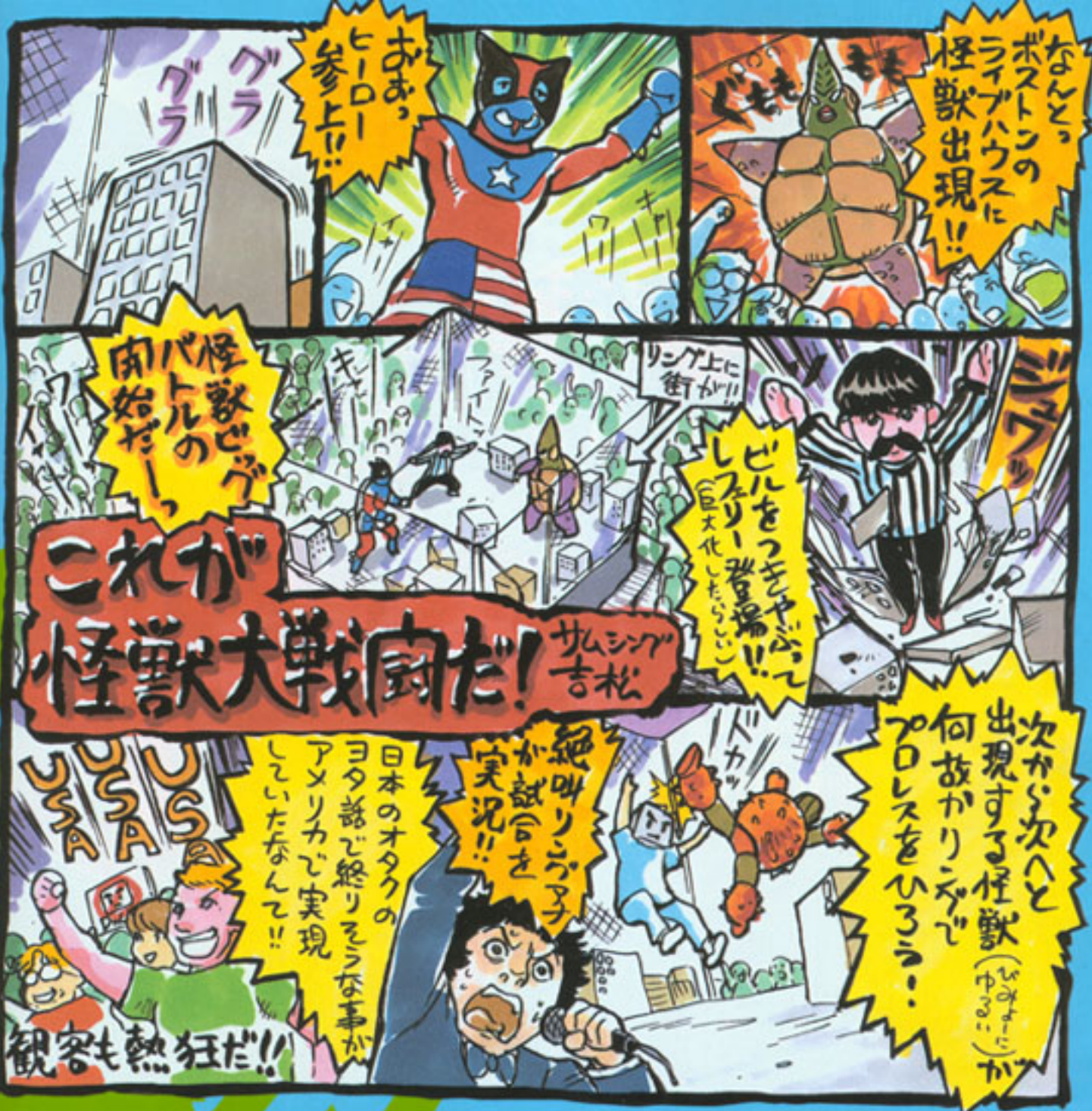
●Something Yoshimatsu 本誌あめごん、週刊プレイボーイに連載を持つ、WWE & ハロプロマニア。その正体は、「十兵衛ちゃん」シリーズや「学園戦記ムリョウ」を手がけた日本屈指のアニメーターである。