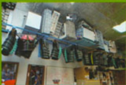
ランドさんたちの秘密基地「怪獣スタジオ」では、円谷プロで戦ったという驚くべき撮影方法を採用している